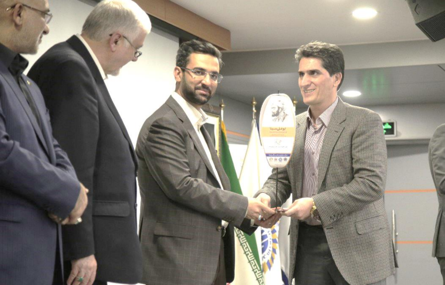
کارخانه فرآوری زغالسنگ پابدانا- تندیس برنزی