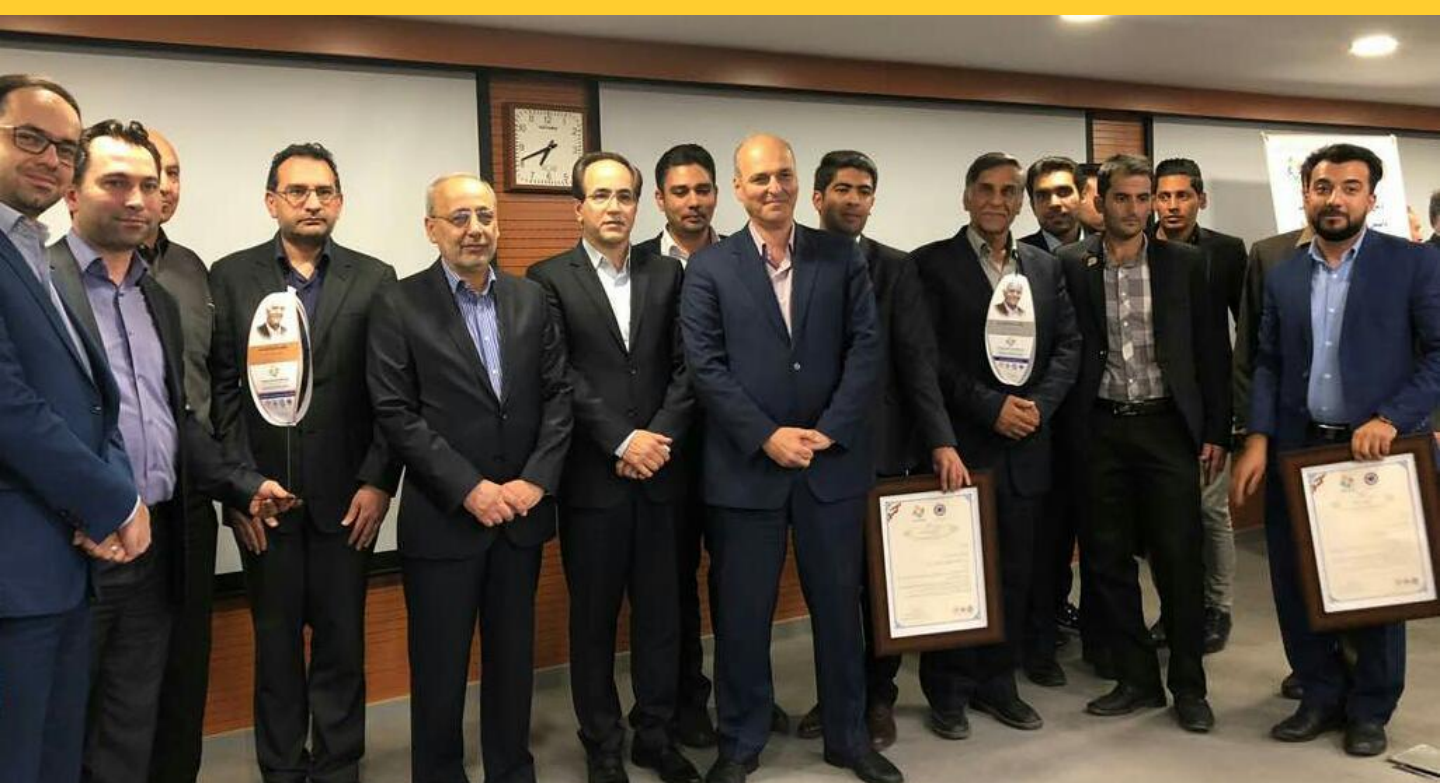
عکس نماینده شرکت ها و مجتمع ها با مدیر عامل محترم میدکو