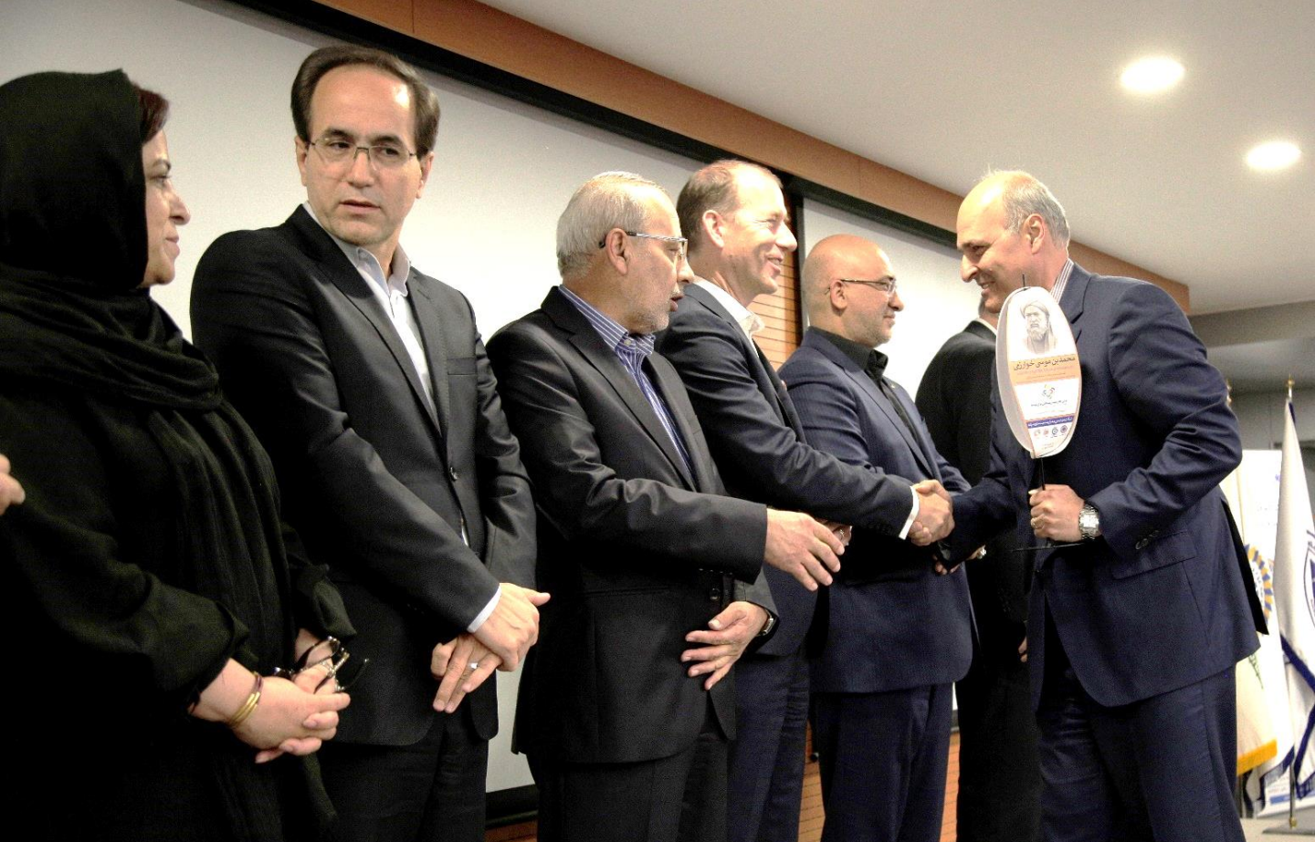
شرکت مهندسی معیار صنعت خاورمیانه - تندیس برنزین