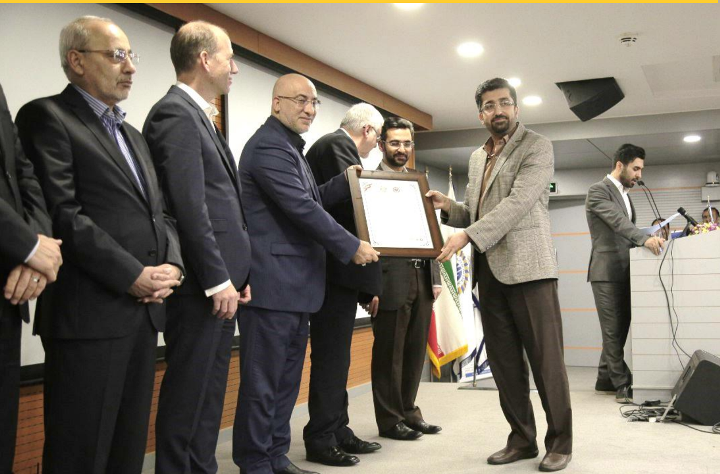
مجتمع بابک مس- گواهینامه ۳ ستاره