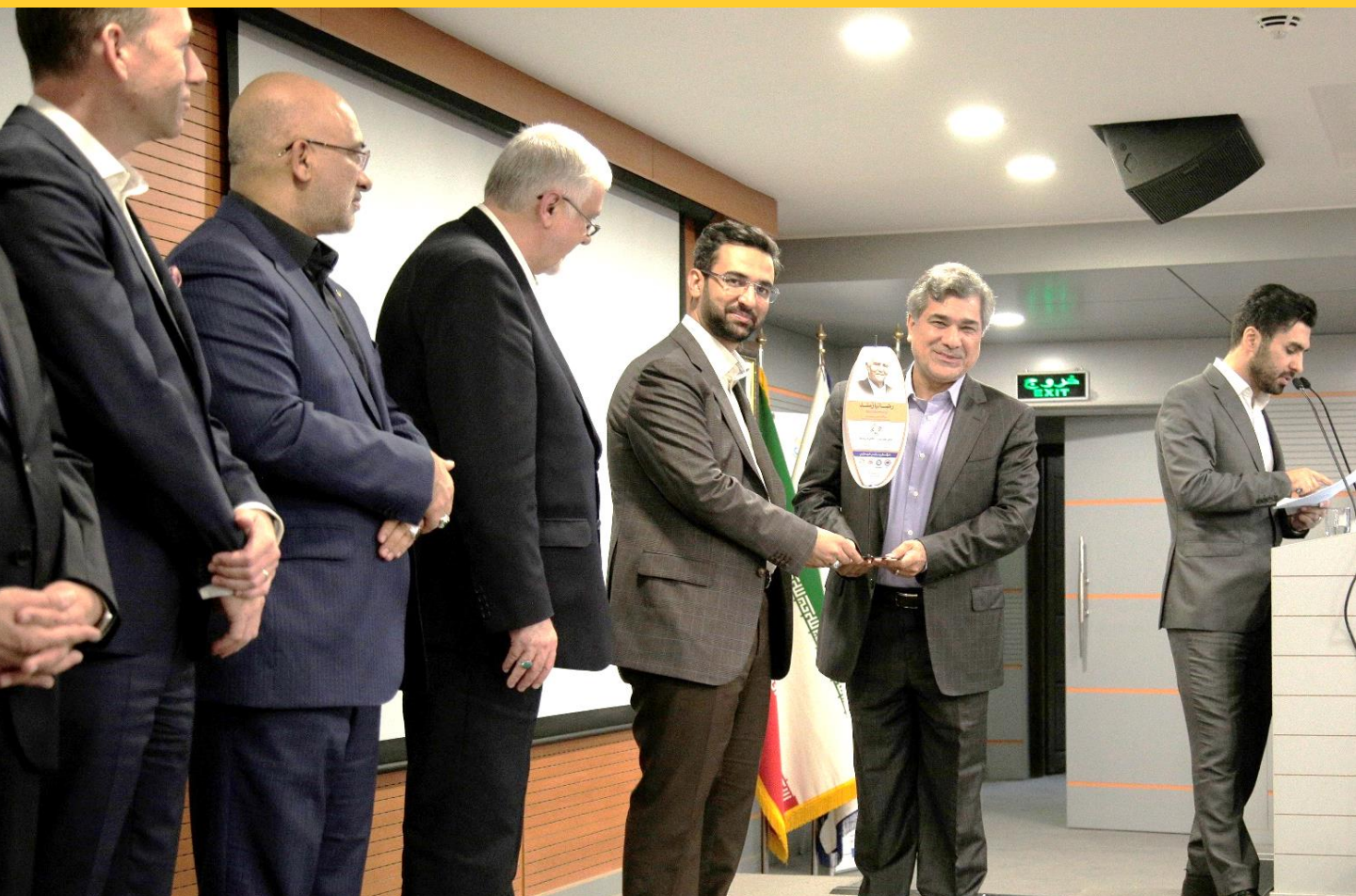
کارخانه فروسیلیس غرب پارس - تندیس برنزین