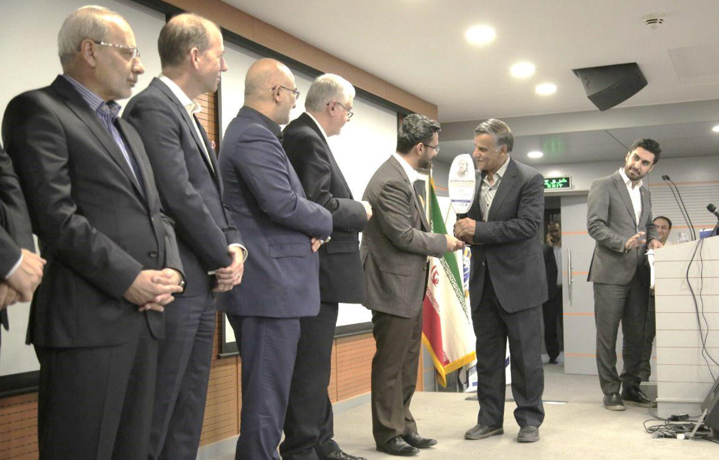
مجتمع فولاد بوتیا- تندیس سیمین