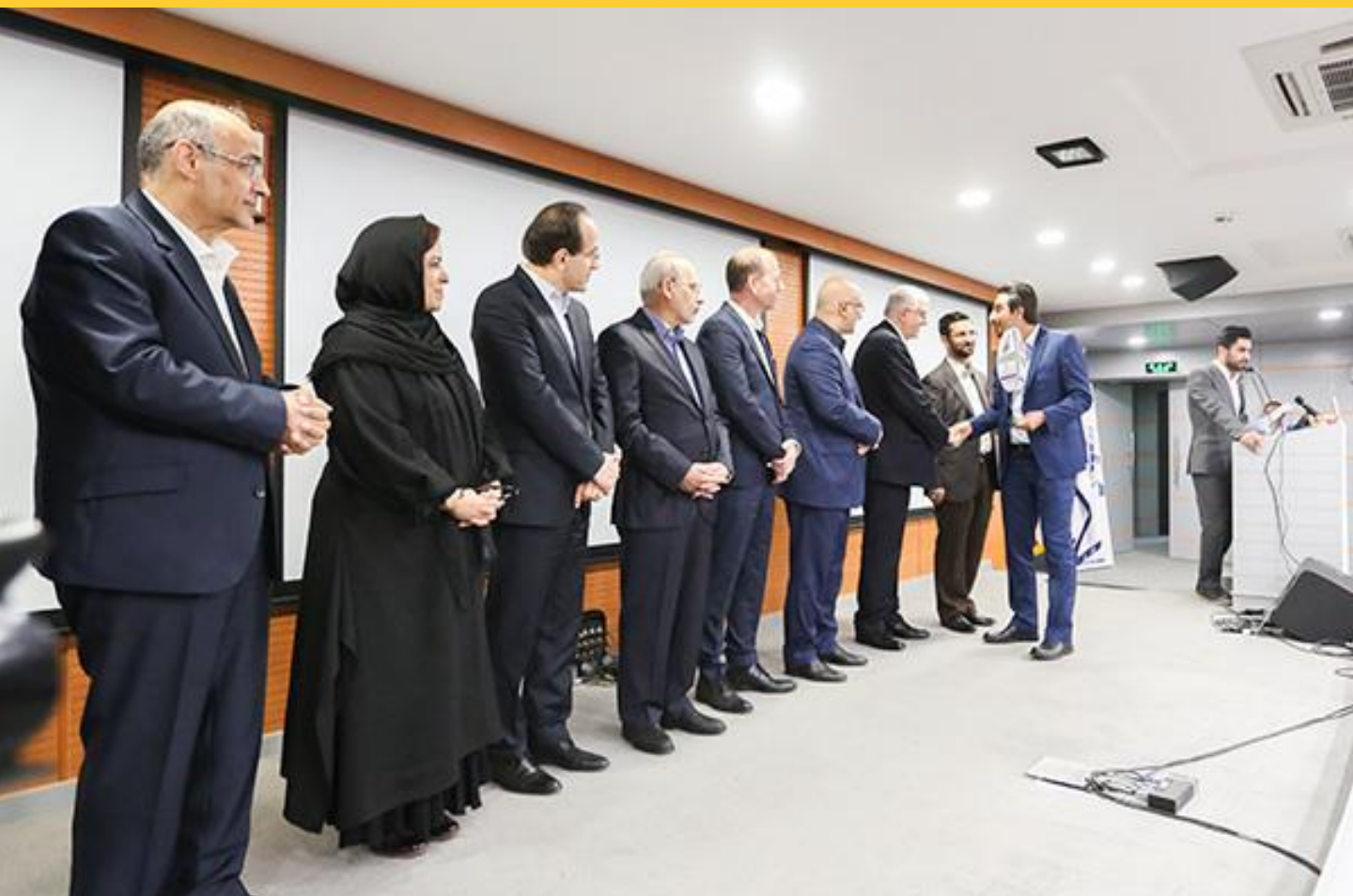
مجتمع فولاد بردسیر- تندیس سیمین