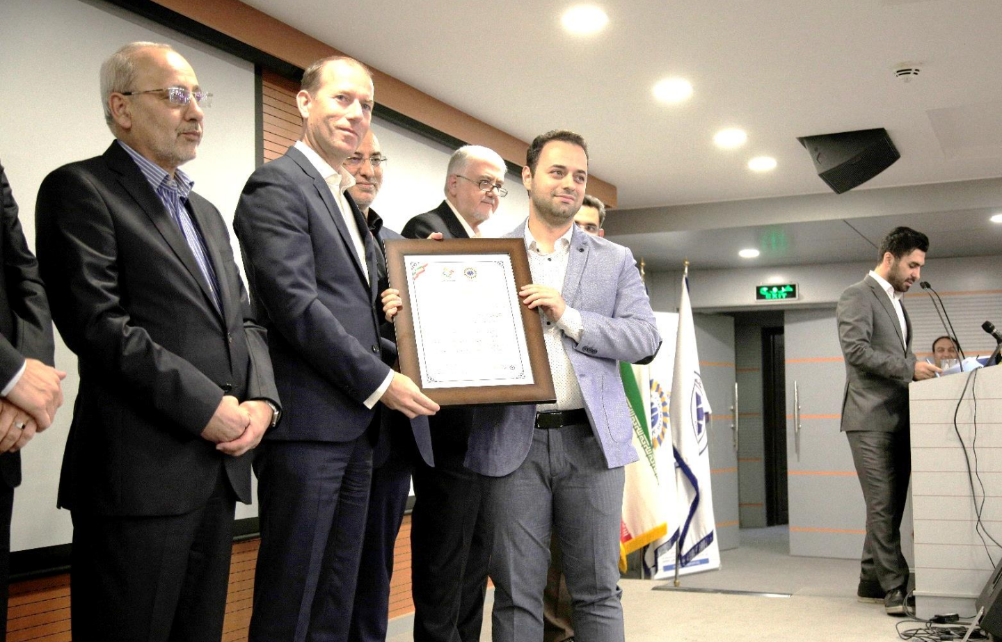
شرکت ساختمانی گسترش و نوسازی صنایع ایرانیان - گواهینامه ۳ ستاره