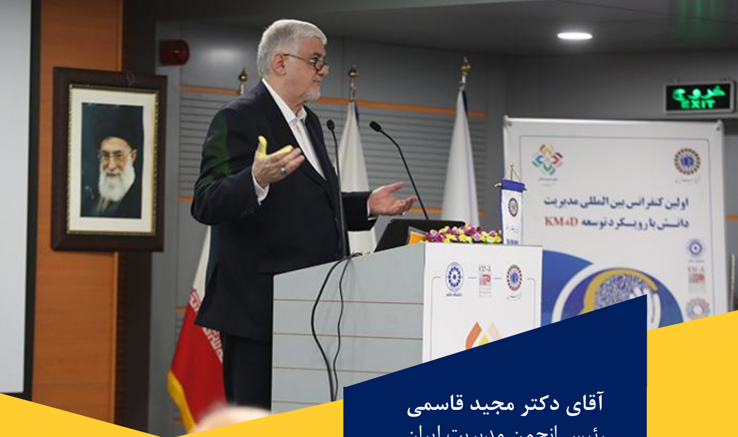
آقای دکتر مجید قاسمی رئیس انجمن مدیریت ایران