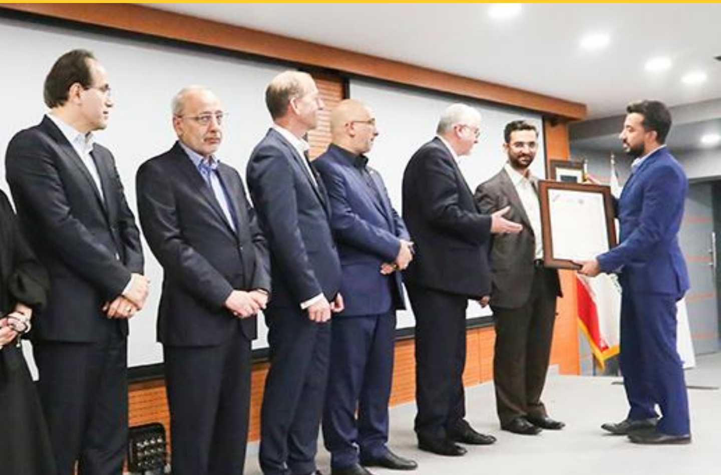
مجتمع کنسانتره و گندله سازی زرنند - گواهینامه ۳ ستاره