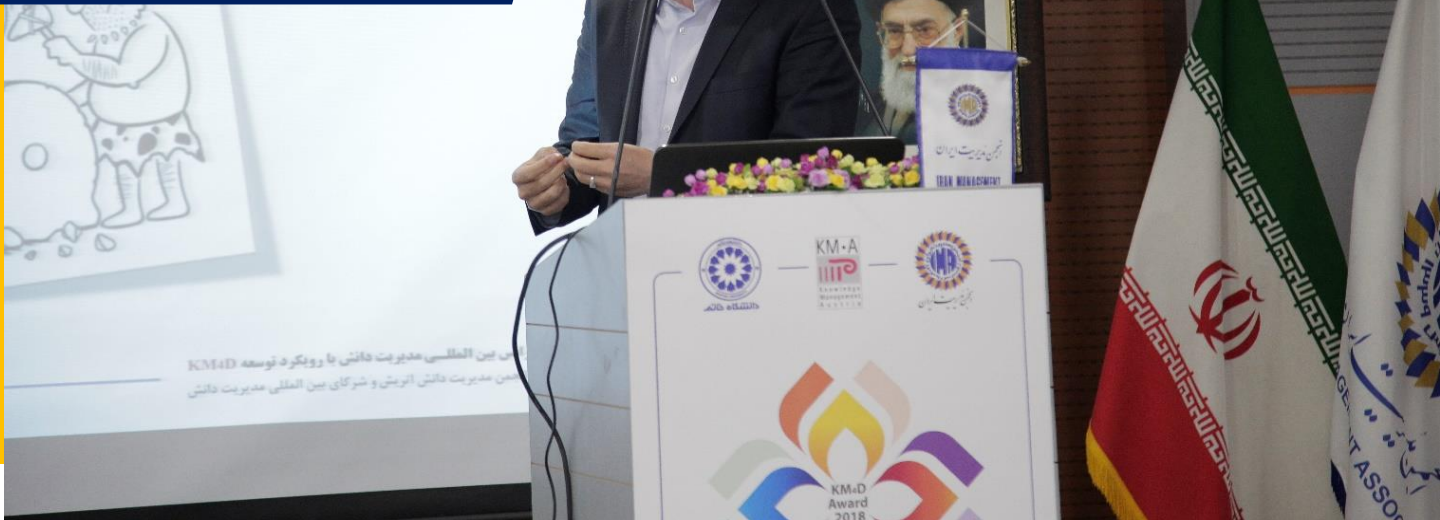
جایگاه مدیریت دانش در اقتصاد دانشی

اولین کنفرانس بین المللی مدیریت دانش با رویکرد توسعه KM4D انجمن مدیریت دانش ایران و شرکای بین المللی مدیریت دانش