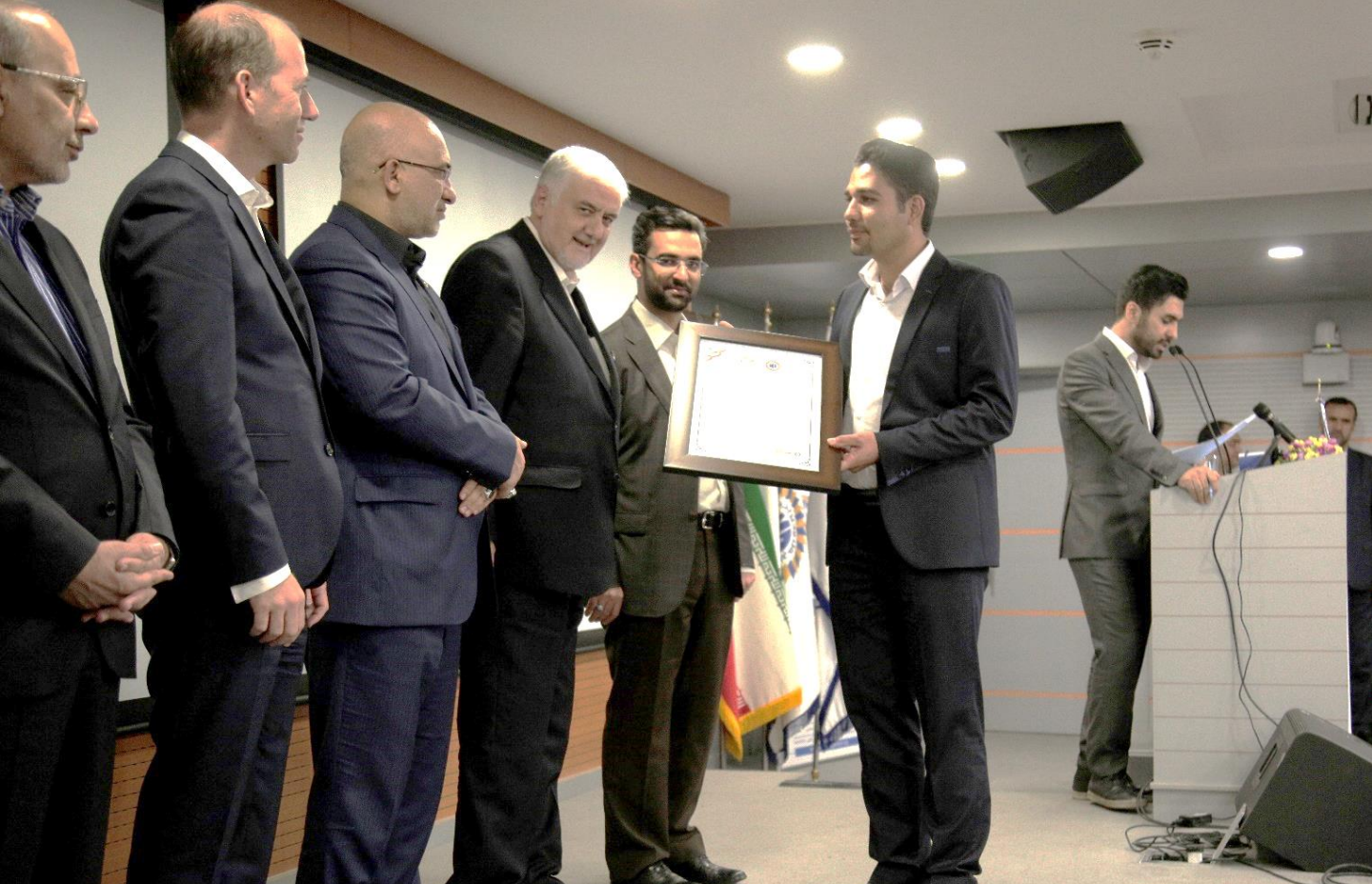
مجتمع کک سازی و پالایشگاه های زرنند-گواهینامه ۲ ستاره