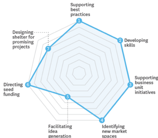
7 ROLES OF P&G'S CORPORATE GROWTH FACTORY

SOURCE EUROPEAN CENTRE FOR STRATEGIC INNOVATION